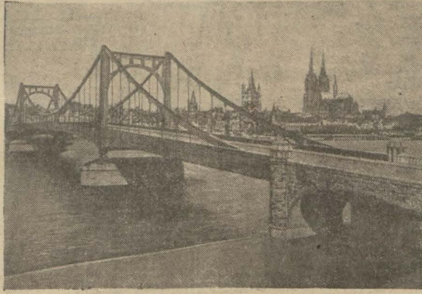
Kolonya şehriden bir görünüş

Aradan geçen zaman içinde Har- kof muharebesi esnasında 6 ncı Sovyet ordusu kumandanı Gene- ral Gordor Janski'nin öldüğü mü- dahede edilmiştir. (Devamı 5 inci sayfada)