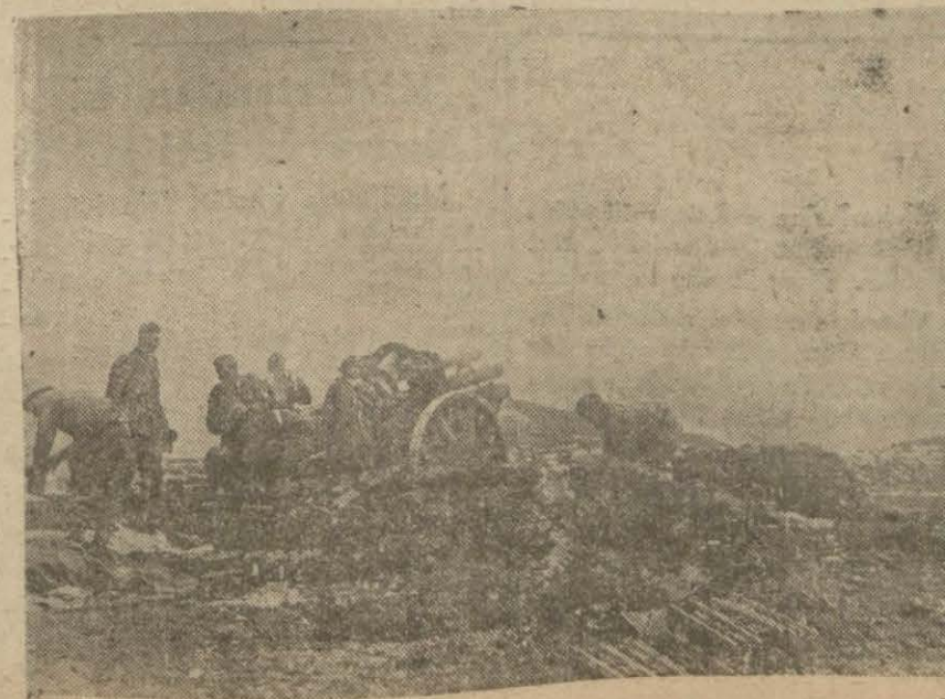
Alman topçusu Kerç taarruzunu hazırlıyor

kuvvetlerine karşı, keza şimali Birmanyanın Hindistan hududu yakınlarındaki Kaleva kesiminde bulunan İngiliz kuvvetlerinden bazılarına karşı Japon kuvvetle- rinin girişmiş oldukları temizleme (Devamı 5 inci sayfada)